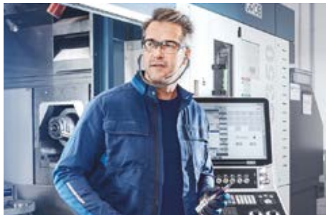
Das Produktportfolio im Bereich der Persönlichen Schutzausrüstung umfasst ein breites Sortiment an Berufskleidung, Handschuhen, Schutzbrillen und weiteren Artikeln.

Die Division D&L International geht entgegen dem anspruchsvollen Marktumfeld von einer stabilen Entwicklung im zweiten Halbjahr 2022 aus. Im Geschäftsjahr 2022 wird daher mit einem organischen Wachstum gerechnet.