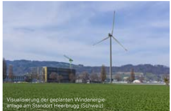
Visualisierung der geplanten Windenergieanlage am Standort Heerbrugg (Schweiz)

Die weitere wirtschaftliche Entwicklung im zweiten Semester 2022 ist von hoher Unsicherheit gekennzeichnet: Geopolitische Spannungen, der Krieg in der Ukraine, ein drohender Energiemangel in Europa, anhaltende Verwerfungen in den Lieferketten und fortwährende Beeinträchtigungen durch die