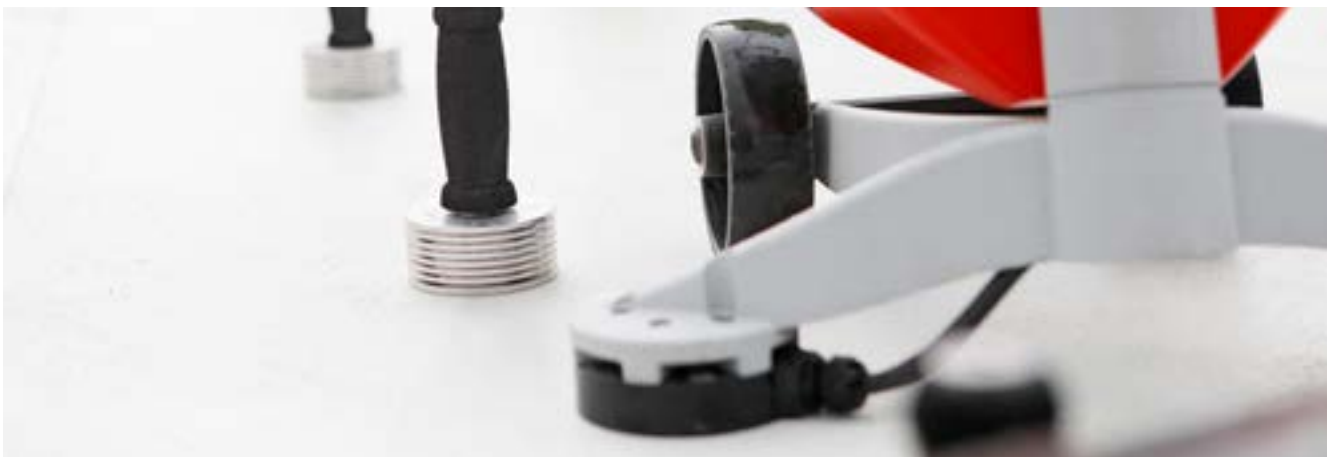
Anwendungen im Bereich Flachdach erfuhren ein starkes Wachstum im ersten Semester 2022. Im Bild: Das durchdringungsfreie Feldebefestigungssystem isoweld, das zur Lagesicherung von Dachabdichtungen auf dem Flachdach verwendet wird.

Im Geschäft mit Kunden aus der Automobilindustrie geht die Division Riveting im zweiten Semester 2022 von einer graduellen Erholung der Kundenabrufe im Vergleich zum ersten Semester aus. Die Unsicherheiten in den weiteren Anwendungsbereichen bezüglich der Entwicklung im zweiten Semester 2022 bleiben hoch. Insgesamt geht die Division Riveting für das Geschäftsjahr 2022 von einer tendenziell flachen Entwicklung aus.