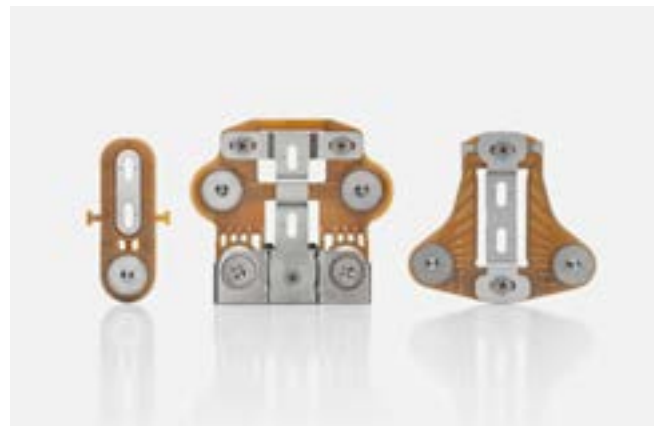
Bracket Logic Concept – Baugruppe zur Befestigung von Flugzeug-Innenkabinen aus dem Bereich Aircraft

Für das zweite Semester 2022 geht die Division Industrial von einem leicht abflachenden Wachstum gegenüber dem ersten Semester aus. Für das Geschäftsjahr 2022 wird ein positives Ergebnis mit organischem Wachstum erwartet. Unsicherheiten bestehen in Bezug auf die Nachhaltigkeit des sehr dynamischen Wachstums im Bereich Aircraft.