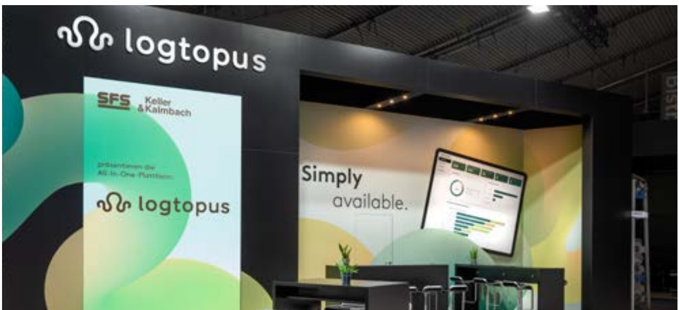
An der Messe LogiMAT wurde die All-in-One-Plattform Logtopus für die intelligente Automatisierung der Materialbeschaffung vorgestellt

Die Division D&L Switzerland geht von einer stabilen Entwicklung im zweiten Halbjahr 2022 gegenüber dem ersten Halbjahr aus. Im Geschäftsjahr 2022 wird mit einem organischen Wachstum gerechnet.