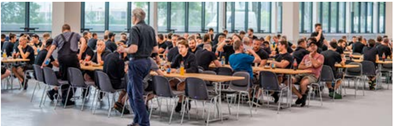
Die fertiggestellte Halle 6 wird vor der Inbetriebnahme der Produktion lokalen Mitarbeitenden sowie Teilen der Bevölkerung an themenbasierten Anlässen gezeigt.

Die Division Automotive erwartet in den kommenden Jahren weiterhin eine gute Marktnachfrage nach neuen Fahrzeugen und Modellen. Die Umsatzausfälle aufgrund der Schwierigkeiten in den Lieferketten dürften in den kommenden Jahren kompensiert werden. Für den weiteren Verlauf des Geschäftsjahres 2022 erwartet die Division eine graduelle Erholung der Kundenabrufe verglichen mit dem ersten Semester. Die Zielsetzung einer Outperformance gegenüber der Marktentwicklung im gesamten Geschäftsjahr 2022 durch die Realisierung von Wachstumsprojekten bleibt bestehen.