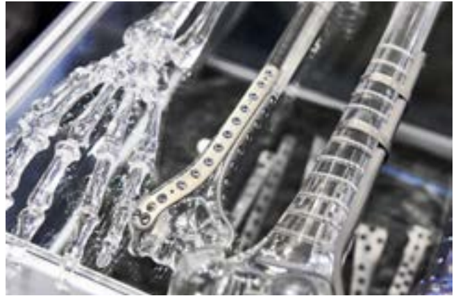
Produkte aus dem Anwendungsbereich Orthopädie der Division Medical

Die Division Medical erwartet im restlichen Jahresverlauf 2022 eine unverändert gute Marktnachfrage und Bestelldynamik. Für das gesamte Geschäftsjahr 2022 wird von einer positiven Umsatzentwicklung gegenüber dem Vorjahr ausgegangen. Die Unsicherheiten betreffend Fachkräftemangel sowie Störungen in den Lieferketten bleiben bestehen.